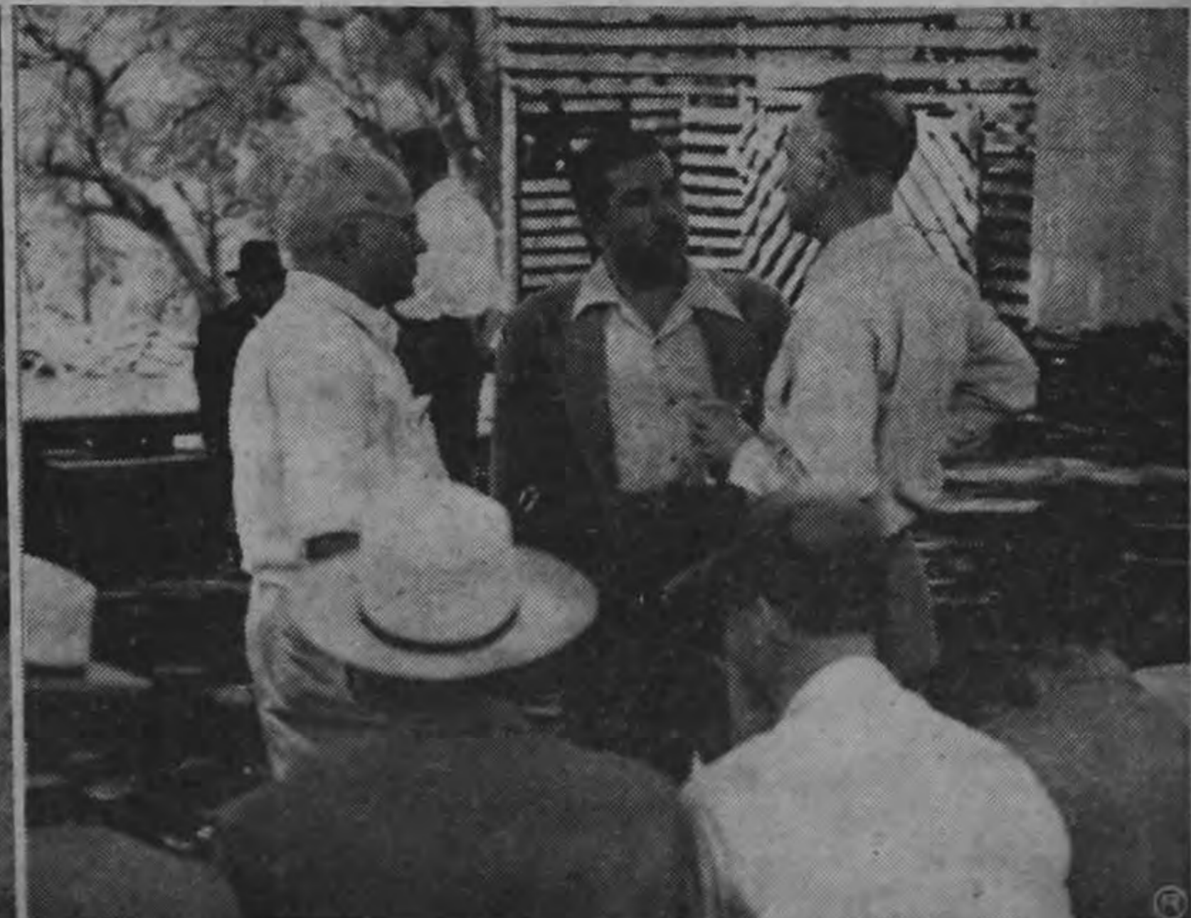
EL PROBLEMA ELECTRICO.—Dos aspectos de la visita que un grupo de diputados y de dirigentes de la Cámara de Industrias efectuaron, a invitación de la Compañía Nacional de Fuerza y Luz, para apreciar, sobre el terreno, las dificultades que se han presentado en las centrales de generación de electricidad a causa de la escasez de aguas, así como también el estado y la intensidad de las obras que se llevan a cabo para instalar la Planta Térmica cuya terminación se anuncia para el próximo año.