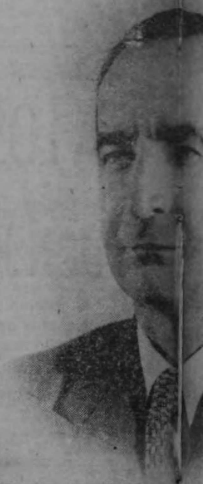
DON JOSE FIGUERES Candidato a la Presidencia periodo 1953 -